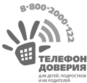
График работы детского телефона доверия в Калужской области – круглосуточно.

Конфиденциальность и бесплатность – два основных принципа работы детского телефона доверия. Это означает, что каждый ребенок и родитель может анонимно и бесплатно получить психологическую помощь, и тайна его обращения на телефон доверия гарантируется.