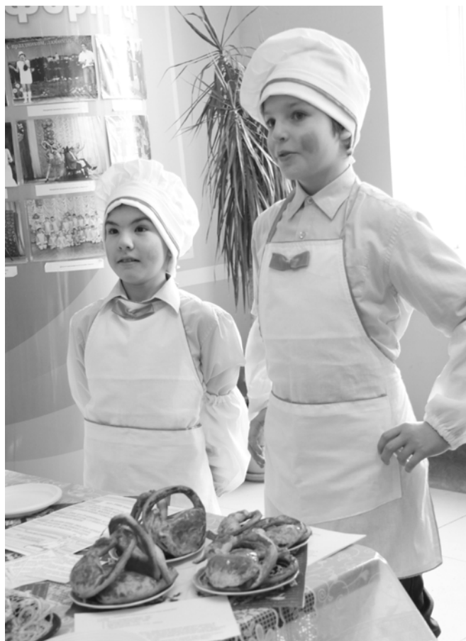
Вот таких поварят можно было увидеть в фойе Дворца культуры накануне 8 Марта.